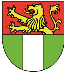
Tarnowo Podgórne Polen (2004)