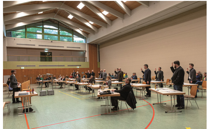
Die zwölf neuen Gemeinderäte bei ihrer Vereidigung