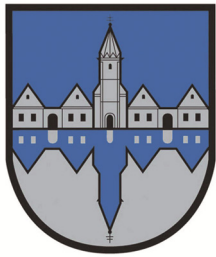
Schattendorf Österreich (2003)