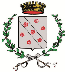
Rosate Italien (2000)