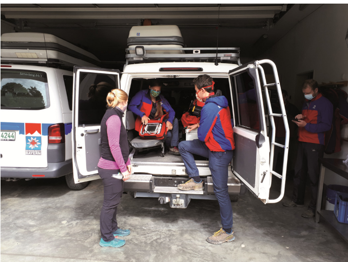
Die Dienstgruppe beim wöchentlichen Fahrzeugcheck

Nach einem ruhigen Winter und einigen Wochen ohne den regulären Dienstbetrieb in der Bergrettungswache Samerberg gibt es wieder einiges zu tun für die Bergretter und Bergretterinnen der Bergwacht Rosenheim – Samerberg. Durch die Corona-Pandemie wurde der Dienst an den Wochenenden und Feiertagen ausgesetzt. In der sonst sehr belebten Bergrettungswache waren über Wochen nur wenige Einsatzkräfte anzutreffen. Während dieser Zeit gab es eine reduzierte Mannschaft, die auch am Wochenende vom Wohnort aus zu den Einsätzen ausrückte. Der Bikepark war geschlossen, die Hochriesbahn nicht in Betrieb und auch die Hütten waren verlassen. Aber auch in dieser Zeit wurden wir zu einigen Einsätzen im Hochriesgebiet gerufen. Seit Anfang Juni ist in der Bergrettungswache in Grainbach wieder eine Dienstmannschaft an den Wochenenden und Feiertagen vor Ort. Jedoch gibt es auch für uns Bergretter und Bergretterinnen zusätzliche Vorkehrungen im Rahmen der Corona-Pandemie zu beachten. Nicht nur bei der Versorgung von Patienten müssen wir uns ausreichend vor