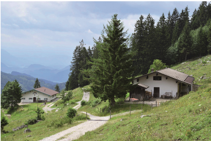
Das alte Almgebäude (l.) liegt zur Hälfte in Tirol. Oberhalb vom Weg baute die Genossenschaft 1970 auf bayerischer Seite das neue Gebäude.