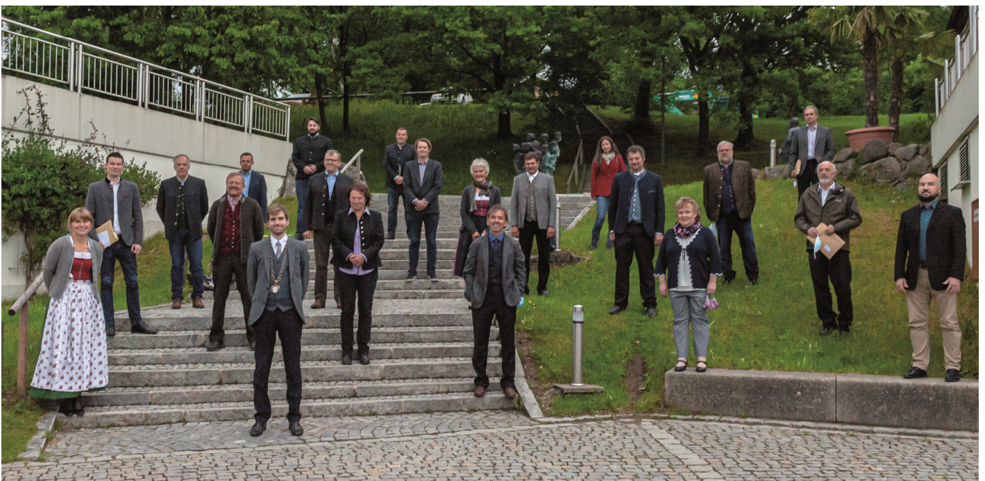
Gruppenbild des neuen Gemeinderates

Text: Gemeinde Rohrdorf