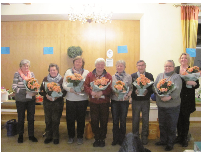
Das Bild zeigt die Preisträger des Blumenschmuckwettbewerbs 2017