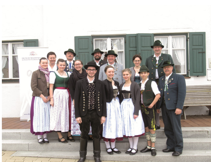
Die Abordnung der Bayerischen Trachtenjugend