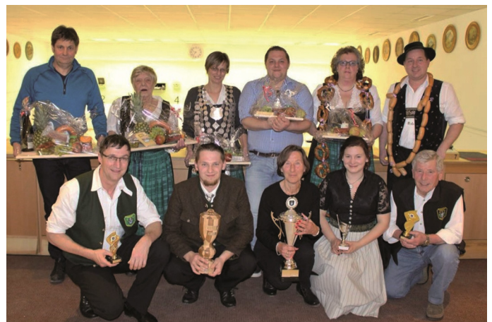
Alle Gewinner des End- und Königsschießens des Schützenvereins „Immergrün“ Lauterbach

Kurz vor Ostern fand das End- und Königsschießen des Schützenvereins „Immergrün“ Lauterbach statt. Insgesamt schossen 23 Schützen um Teiler und Ringe. Schützenköni-