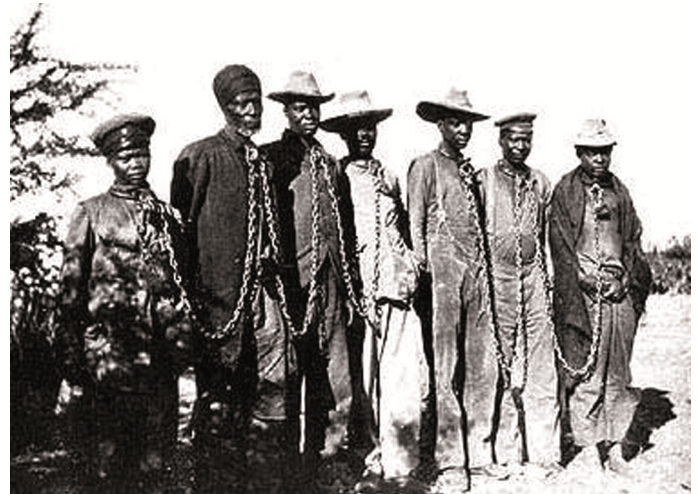
Gefangene Hereros 1904.

Unter der Führung von Oberhäuptling Samuel Maharero sammelten sich im August an die 5.000 Hererokrieger am Waterberg und es kam zum Kampf mit den mit Maschinengewehren ausgerüsteten deutschen Truppen. Wer von den Hereros nicht erschossen wurde, flüchtete in die wasserlose Wüste und verdurstete dort. Nur wenige haben dieses Schicksal überstanden.