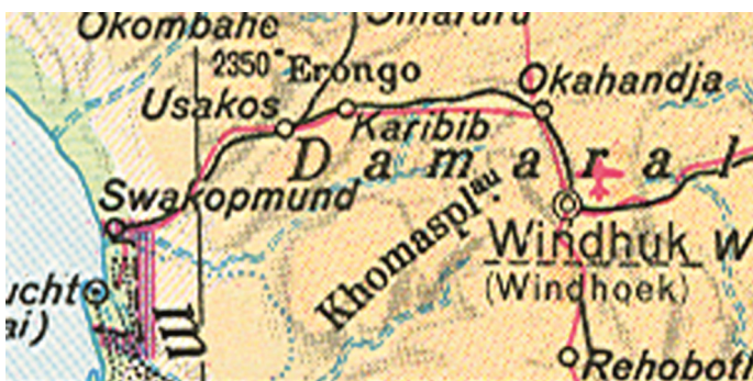
Ausschnitt aus einem Weltatlas. Swakopmund-Windhuk ca.350 km. – Straße, – Eisenbahn

Zum Schutz der deutschen Farmer und der von Deutschen gebauten Schmalspurbahn zwischen der Hafenstadt Swakopmund und der Hauptstadt Windhuk wurden die Kaiserlichen Schutztruppen entlang der Eisenbahn stationiert.