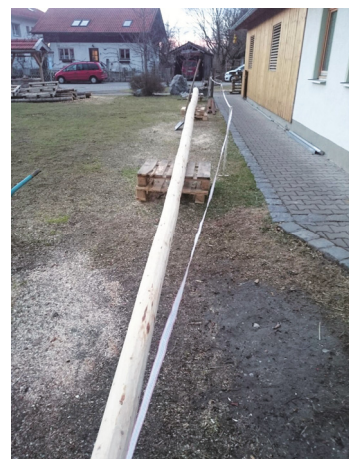
Der 19 Meter lange Maibaum

Das Haus St. Anna mit seinen Bewohnern und deren Angehörigen hat diese alte Tradition mehr als verdient, denn was wären wir ohne unsere Mütter und Väter? Auf zahlreiches Kommen freuen sich das gesamte Haus St. Anna und der Stopselclub Thansau e.V..