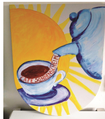
Maibaumtafeln für den neuen Maibaum im St. Anna

Nach dem Christkindlmarkt am Eselstall strebt der Stopselclub Thansau wieder nach neuen frischen Taten.