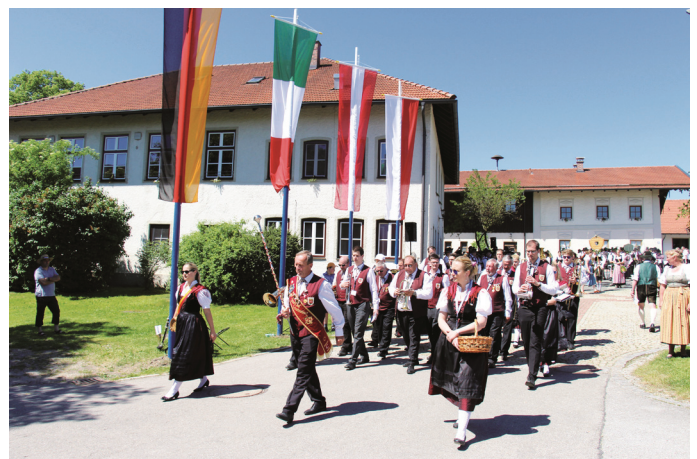
Der Musikverein „Frisch Auf“ Schattendorf beim Abmarsch zum Festzelt