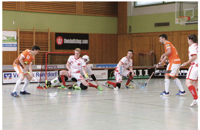
Szene aus dem Spiel um den dritten Platz zwischen Rohrdorf und Bordesholm

Als nächster Gegner in der Gruppenphase wartete der TSV Bordesholm. Mit der Mannschaft, die fast von Kiel aus zur DM angereist war, stand noch eine Rechnung von der letztjährigen Meisterschaft offen. Damals hatte Rohrdorf knapp und etwas unglücklich mit 6:7 gegen die Schleswig-Holsteiner verloren. Zunächst sah es so aus, als könnten die Lumberjacks diesmal die Oberhand behalten, doch eine 2:0-Führung verwandelte sich nach einer längeren Schwächephase in einen 2:7-Rückstand. Wer nun gedacht hatte, der Drops sei gelutscht, wurde eines Besseren belehrt: Die Lumberjacks gaben ungeachtet des deutlichen Rückstands nicht auf und kamen Tor um Tor heran, bis es eine Minute vor Spielende 6:7 stand. Als alle auf den Ausgleich warte-