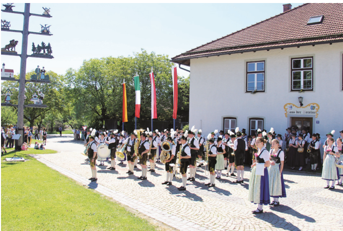
Heimspiel für die Musikkapelle Rohrdorf in Höhenmoos