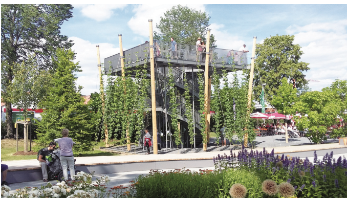
Hopfenturm, das Wahrzeichen der Gartenschau Pfaffenhofen

Ähnlich wie die Landesgartenschau in Rosenheim präsentierte sich für die Gartler aus Höhenmoos die kleine aber feine Gartenschau in Pfaffenhofen a. d. Ilm. Das Gelände ist in die Stadt eingegliedert, sodass man leicht vom Festplatz über den Bürgerpark oder den Sport- und Freizeitpark bis in das Stadtzentrum und die Ilminsel gelangen kann. Die sorgfältig gestalteten Themen wie z.B. die Blumenhalle, oder das Schmetterlingshaus, Wald der Sinne, Musikplatz