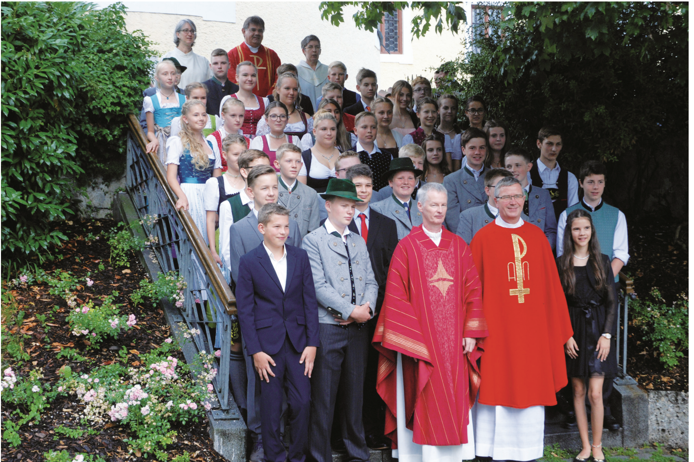
Die Firmlinge aus Rohrdorf und Lauterbach