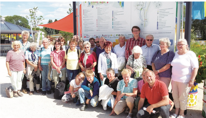
Die Reisegruppe am Haupteingang der Landesgartenschau in Pfaffenhofen/Ilm

Ähnlich wie die Landesgartenschau in Rosenheim präsentierte sich für die Gartler aus Höhenmoos die kleine aber feine Gartenschau in Pfaffenhofen a. d. Ilm. Das Gelände ist in die Stadt eingegliedert, sodass man leicht vom Festplatz über den Bürgerpark oder den Sport- und Freizeitpark bis in das Stadtzentrum und die Ilminsel gelangen kann. Die sorgfältig gestalteten Themen wie z.B. die Blumenhalle, oder das Schmetterlingshaus, Wald der Sinne, Musikplatz