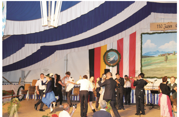
Dass Musik über alle Grenzen hinweg verbindet, zeigte sich beim gemeinsamen Tanzen nach dem Konzert