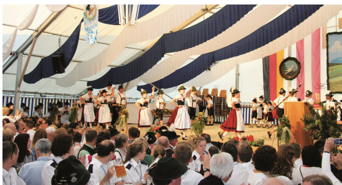
Die Auftritte des Trachtenvereins Höhenmoos begeisterten die Gäste