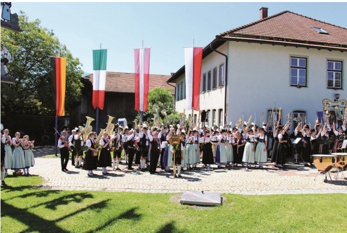
Natürlich durfte auch der obligatorische Musikantengruß nicht fehlen