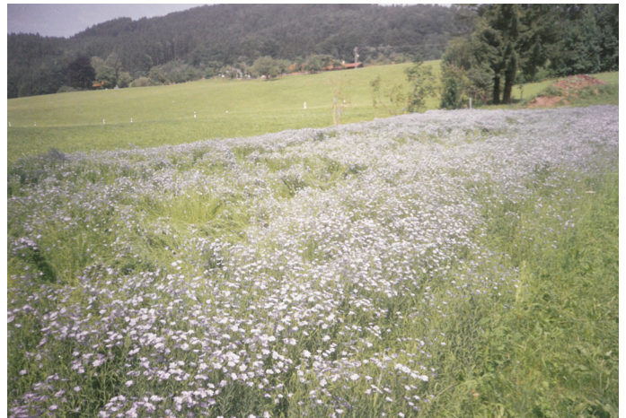
Blühendes Flachsfeld. Im Hintergrund Hundham

schah im November und wird in einem zweiten Teil in der nächsten RSZ erläutert.