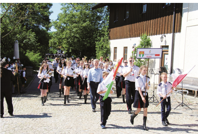
Einmarsch der Jugendblaskapelle Tarnowo Podgórze zum Tag der Blasmusik