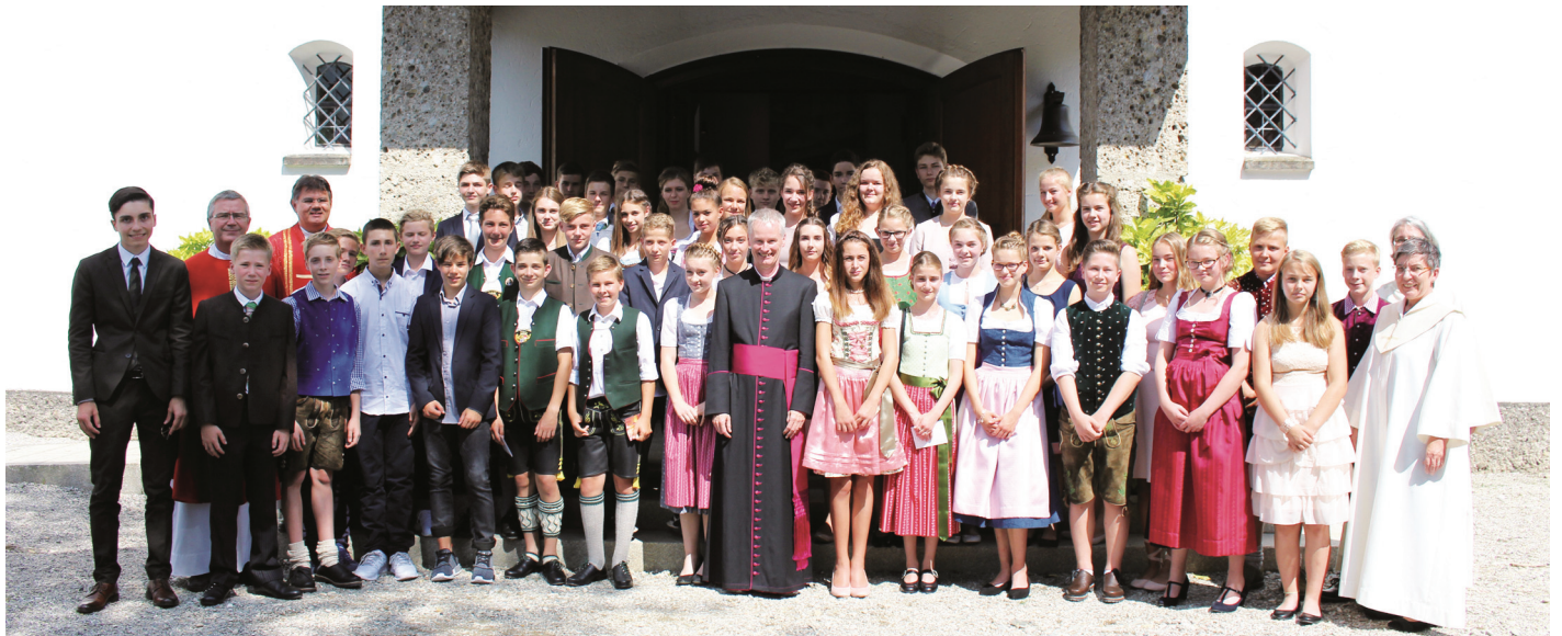
Die Firmlinge aus Thansau und Höhenmoos