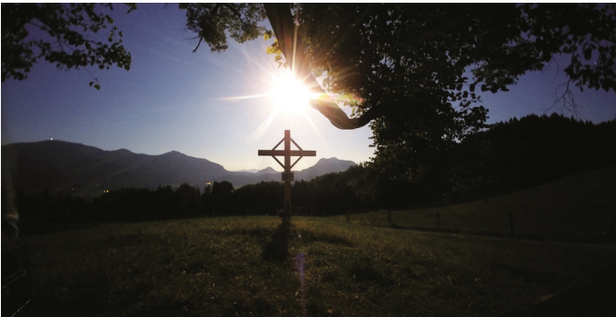
Diese Aufnahme stammt aus den späten Abendstunden und zeigt das Mond-beleuchtete Bergkreuz bei Dorfen.

um sichtbaren Linde errichtet. Wie ein roter Faden hatte sich dieses Projekt durch die Firmvorbereitung der elfköpfigen Gruppe gezogen, am Ende der zahlreichen Gruppenstunden stand die Segnung des Kreuzes durch Diakon Günter Schmitzberger, der sich bei allen Beteiligten für ihre Engagement bedankte. Musikalisch begleitet wurde die Einweihungsfeier von der Samerberger Firmband.