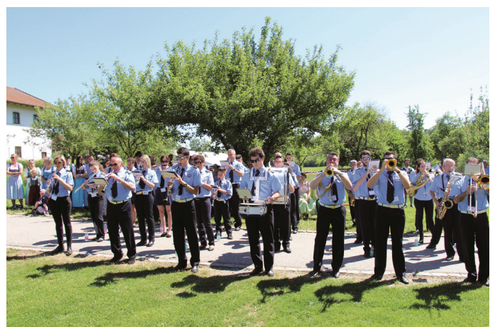
Die Musiker aus Rosate waren für ihren Auftritt in der Sonne gut ausgerüstet

Wer aufhört zu werben, um Geld zu sparen, kann ebenso seine Uhr anhalten, um Zeit zu sparen.