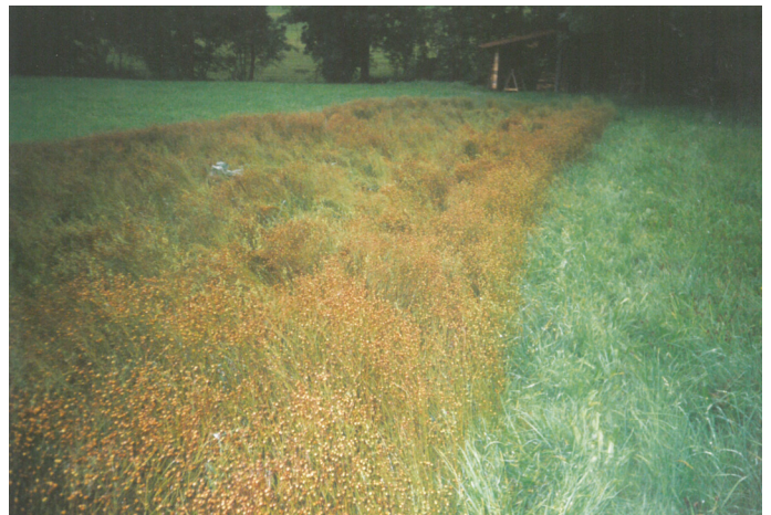
Reifer Flachs mit Samenkörnern

Fast jeder Landwirt hatte früher ein kleines Feld auf dem er Lein aussäte. Die blauen Blüten im Juni brachten in der Landschaft eine farbenfrohe Abwechslung zwischen die Felder und prägten das Aussehen ganzer Landschaften.