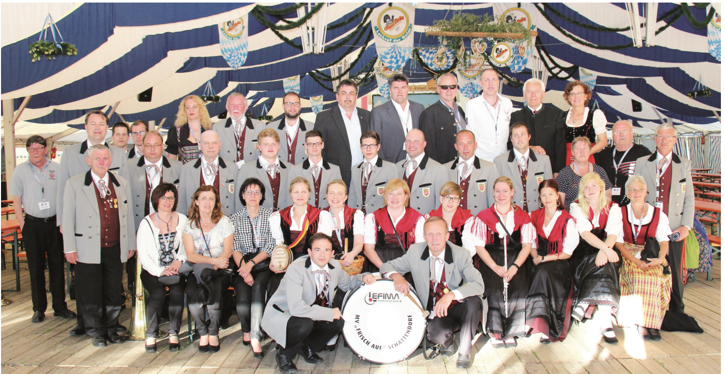
Gruppenfoto der Teilnehmer aus Schattendorf