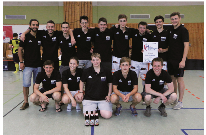
Die Lumberjacks Rohrdorf belegten den vierten Platz bei der Deutschen Meisterschaft