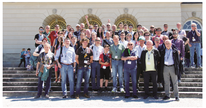
Die italienischen Gäste bei strahlendem Sonnenschein vor dem Schloss Herrenchiemsee