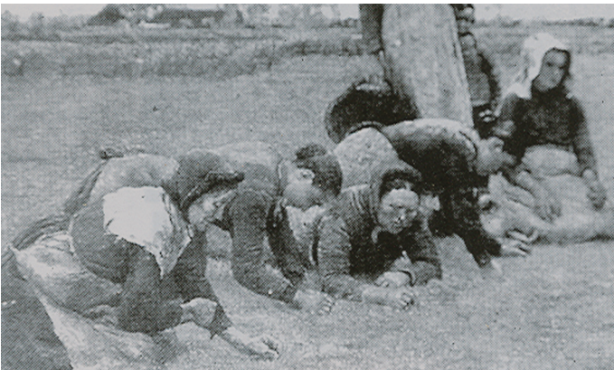
Frauen beim Ausgrasen eines Flachsfeldes

Der Lein, so nannte man eigentlich nur die Samenkörner. Die Pflanze erhielt schon den Namen Flachs und aus der Flachsfaser wurde „das Haar“. Alle drei Namen waren gebräuchlich. In unserer Gegend wurde der Lein Anfang Mai auf einem Acker ausgesät. Nach der Aussaat keimt mit dem Leinsamen auch das ungeliebte Unkraut. Um den Acker unkrautfrei zu halten, musste gejätet werden. Für die dazu eingesetzten Frauen war das eine sehr anstrengende Beschäftigung. Das durch das Hinknien verursachte Umknicken der Pflanzen schadete ihnen nicht, sie richteten sich wieder auf.