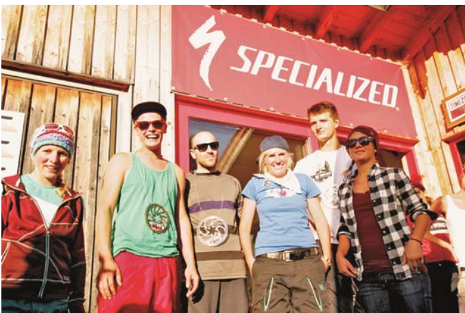
Die Sieger des Rennens