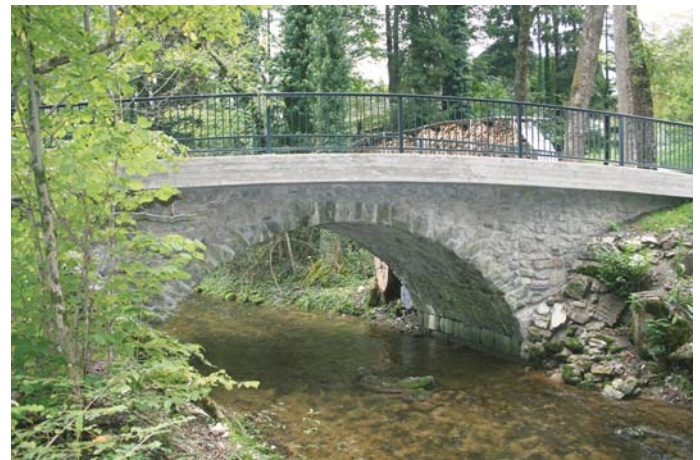
nach der Sanierung