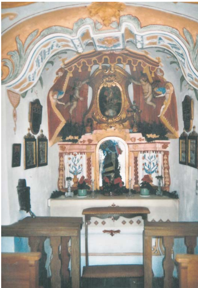
Innenansicht der Kapelle in Geiging