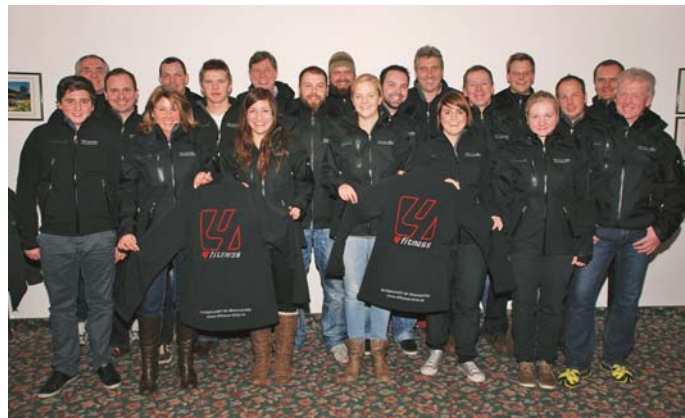
Die Rohrdorfer Skilehrer mit den neuen Jacken.