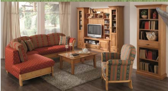
Tisch in jeder Größe und individueller Bemalung