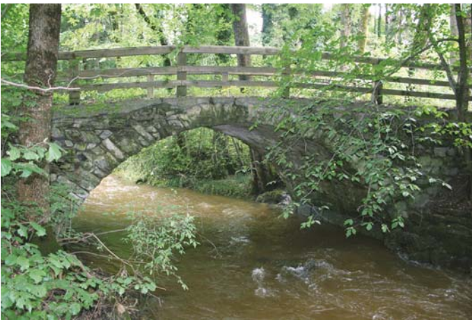
vor der Sanierung