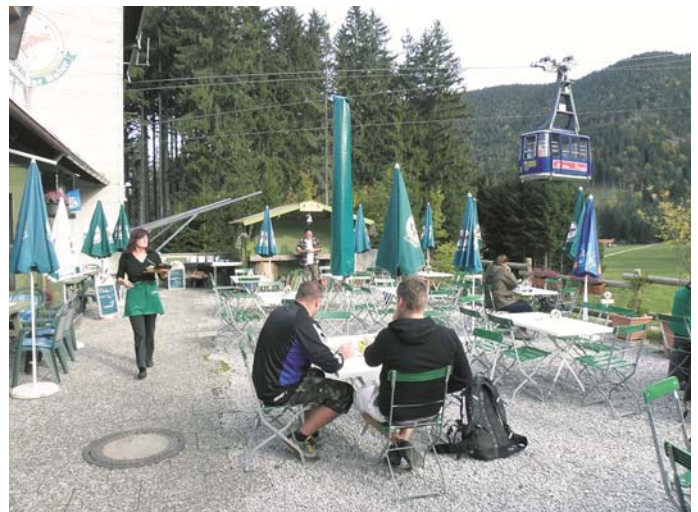
Besuch bei der Kräuterhexe