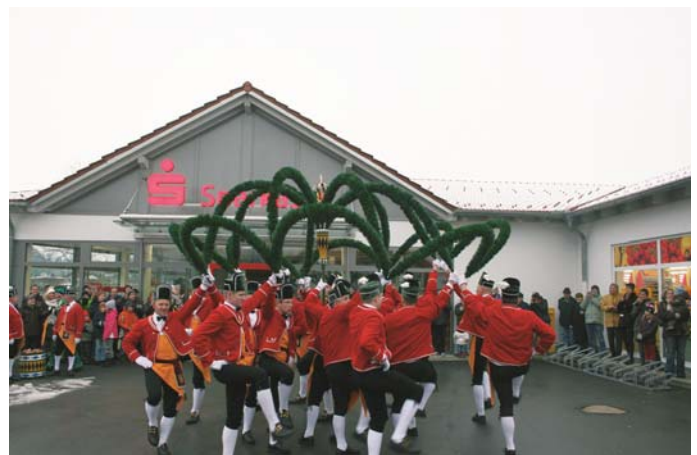
Höhepunkt des Tanzes ist die Figur „Krone“

Da der Schäfflertanz nach alter Tradition nur alle sieben Jahre aufgeführt wird, gibt es erst im Jahr 2019 Gelegenheit für ein Wiedersehen. Text und Fotos: Gemeinde Rohrdorf