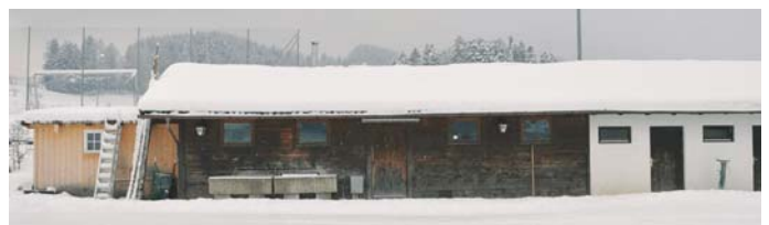
Die baufälligen WSV Umkleidekabinen am Fußballplatz Roßholzen sollen bald einem Neubau weichen.

Von der Gemeinde erwarte der WSV einen Zuschuss in Höhe von 100 000 Euro auf zwei Haushaltsjahre verteilt sowie eine mögliche Zwischenfinanzierung der BLSV-Fördermittel.