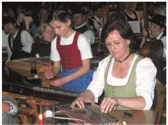
Miteinander musizieren beim Hoagascht