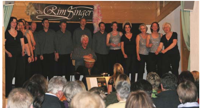
„Die Rimsinger“ bei ihrem Konzert

Die Frauengemeinschaft Höhenmoos lud zu einem besonderen Konzert ins Dorfhaus Achenmühle ein. Die a capella Gruppe „Die Rimsinger“ stellten ihr neues Programm „S'Lebn is wia a Traum“ vor. Neben Klassikern von den Comedian Harmonists waren auch alte deutsche Lieder, Songs von Abba und den Beatles zu hören. Passend zu den Liedern witzig gekleidet sorgten die Sänger mit ihren Darbietungen für einen vergnüglichen Abend.