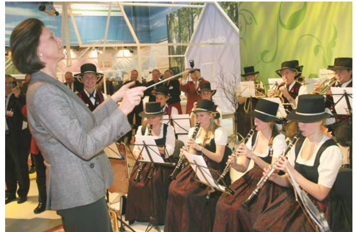
Die Bundeslandwirtschaftsministerin Ilse Aigner beim dirigieren.