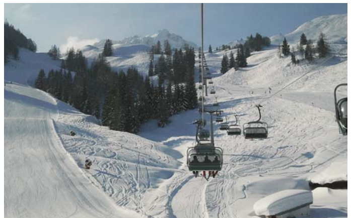
Leere Pisten in Fieberbrunn